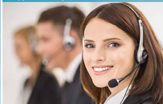
Mise en service