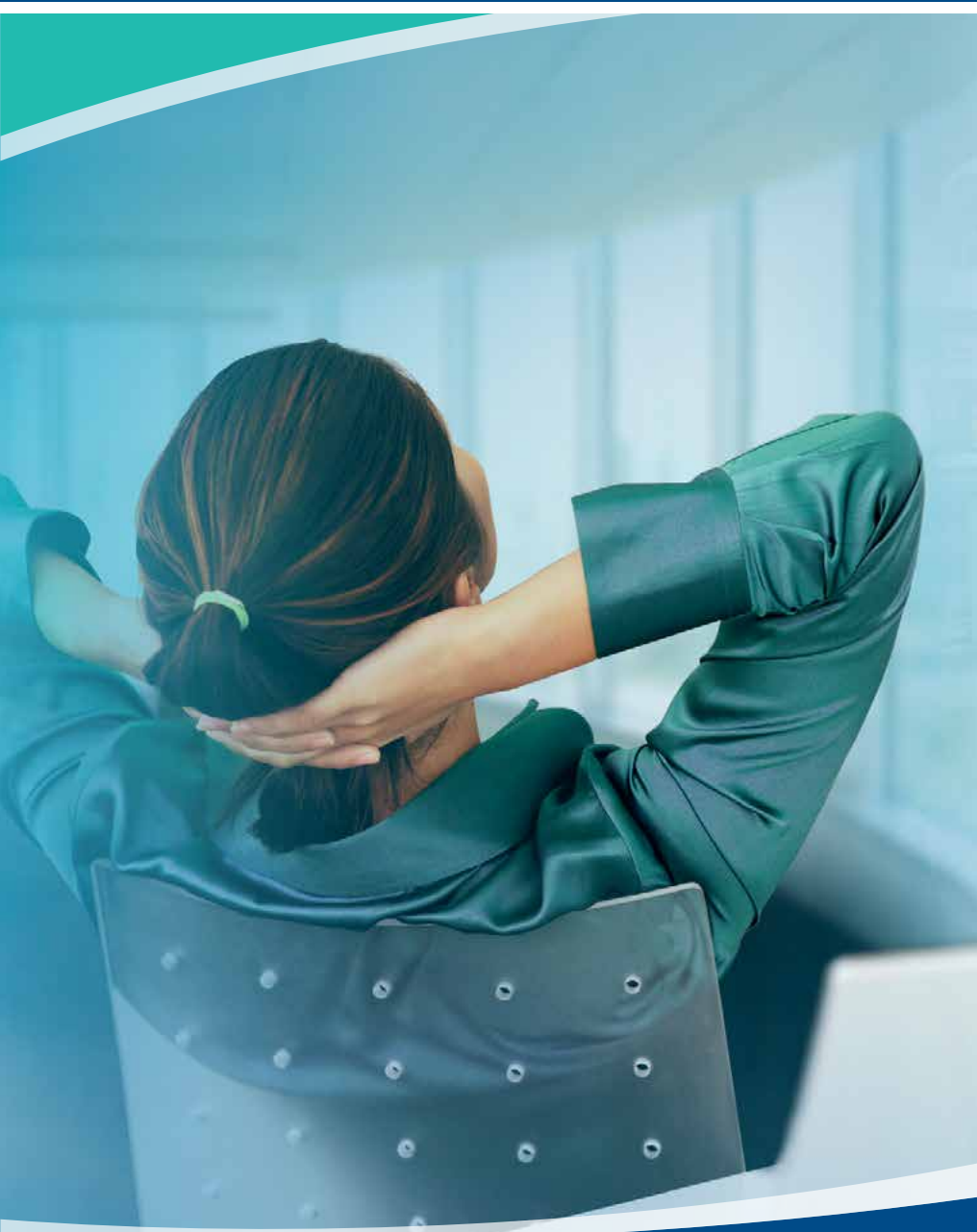
Support technique & Hotline SAV