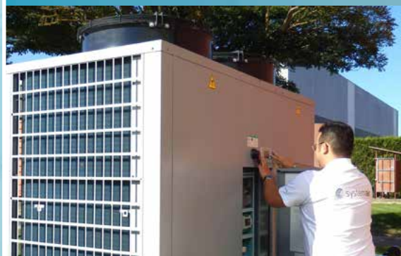
Contrats de maintenance constructeur